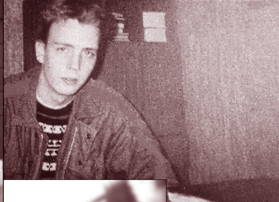
① Der Sohn von Frau Mauritz heute. Dieses Foto erhielt Frau Mauritz beim ersten Wiedersehen ihres Sohnes im Gerichtssaal.

Recherche zu einem Dokumentarfilm von Matthias Kern & Vera Vogt