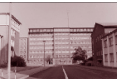
➊ Ehemaliges Ministerium für Staatssicherheit, heute Sitz der Hilfsorganisation für Opfer von Stasiterror und SED-Diktatur.